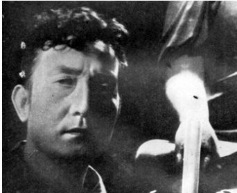
1938 TEMPÊTE SUR L'ASIE (Sturm über Asien) de Richard Oswald