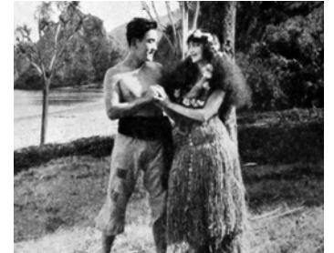
1917 LA BOUTEILLE ENCHANTÉE (The Bottle Imp) de Marshall Neilan avec Lehua Waipahu