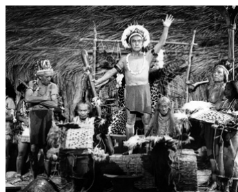
1959 LES VERTES DEMEURÉS (Green Mansions) de Mel Ferrer avec Michael Pate