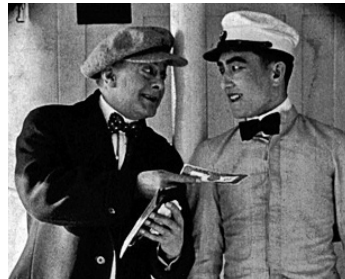
1918 FILS D'AMIRAL (His Birthright) de William Worthington avec Howard Davies