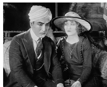
1920 THE DEVIL'S CLAIM de Charles Swickard avec Rhea Mitchell