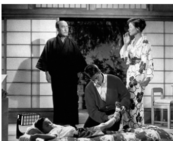
1958 LE KID EN KIMONO (The Geisha Boy) de et avec Jerry Lewis, Nobu McCarthy