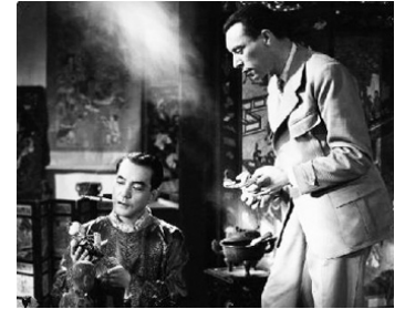
1937 FORFAITURE de Marcel L'Herbier avec Louis Jouvet