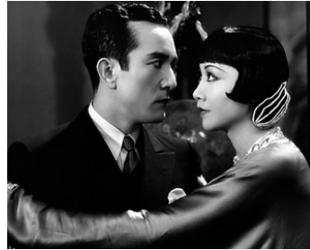
1930 LA FILLE DU DRAGON (Daughter of the Dragon) de Lloyd Corrigan avec Anna May Wong