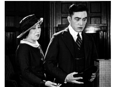
1919 THE COURAGEOUS COWARD de William Worthington avec Tsuru Aoki