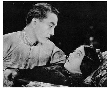
1922 CINQ JOURS À VIVRE (Five days to live) de Norman Dawn avec Tsuru Aoki