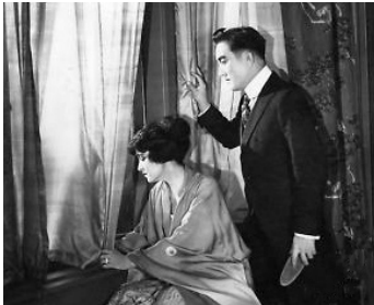
1917 LA BLESSURE QUI SAUVE (The hidden Pearls) de George Melford avec Florence Vidor