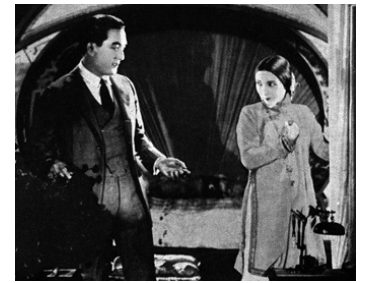
1922 LA COLÈRE DES DIEUX (The Vermillion Pencil) de Norman Dawn avec Bessie Love