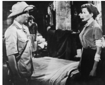
1950 CAPTIVE À BORNÉO (Three came home) de Jean Negulesco avec Claudette Colbert