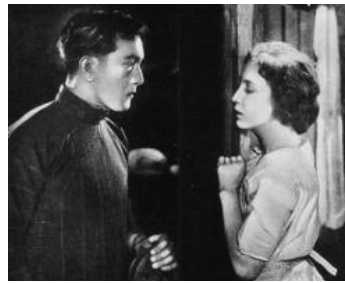
1921 LE DEVIN DU FAUBOURG (The Swamp) de Colin Campbell avec Bessie Love