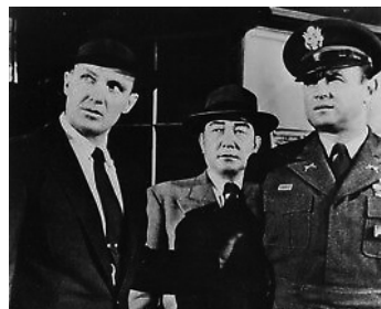
1954 MAISON DE BAMBOU (House of Bamboo) de S. Fuller avec Robert Stack, Brad Dexter