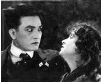
1917 LE JEU SECRET (The Secret Game) de William C. DeMille avec Florence Vidor