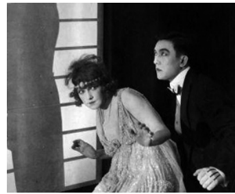
1915 FORFAITURE (The Cheat) de Cecil B. DeMille avec Fannie Ward