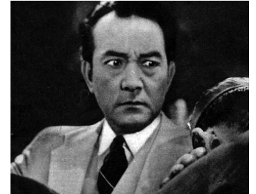
1945 QUARTIER CHINOIS de René Sti