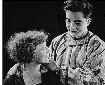
1917 LA VOIX DU SANG (The City of dim Faces) de George Melford avec Doris Pawn