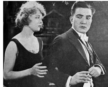
1919 LE SOUPÇON (His Debt) de William Worthington avec Jane Novak