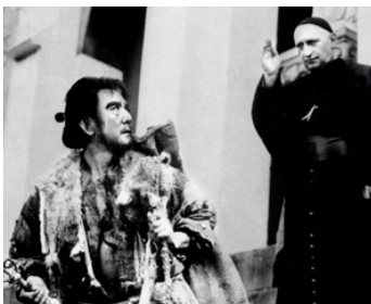
1950 LES MISÉRABLES (Re Mizeraburu, kami to jiju no hata) de Masahiro Makino