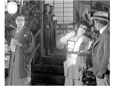
1917 HARA-KIRI (Hashimura togo) de William C. DeMille avec Florence Vidor, Walter Long