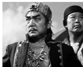
1959 LES ROBINSONS DES MERS DU SUD (Swiss Family Robinson) de Ken Annakin