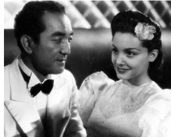
1939 MACAO, L'ENFER DU JEU de Jean Delannoy avec Louise Carletti