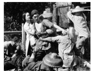
1921 L'AINÉ (The first Born) de Colin Campbell avec Anna May Wong