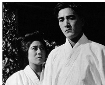
1919 THE DRAGON PAINTER de William Worthington avec Tsuru Aoki