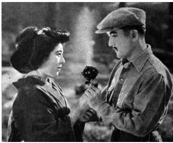
1921 LES ROSES NOIRES (Black Roses) de Colin Campbell avec Tsuru Aoki