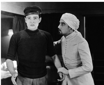
1919 THE MAN BENEATH de William Worthington avec John Gilbert