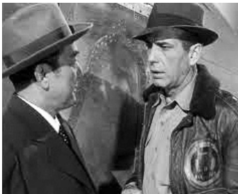
1949 TOKYO JOE (Tokyo Joe) de Stuart Heisler avec Humphrey Bogart