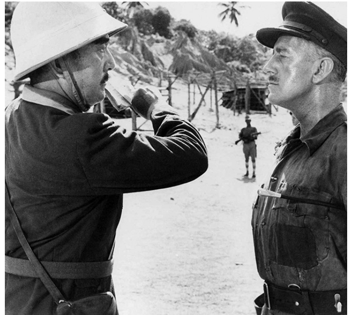
1957 LE PONT DE LA RIVIÈRE KWAÏ (The Bridge on the River Kwai) de David Lean avec Alec Guinness