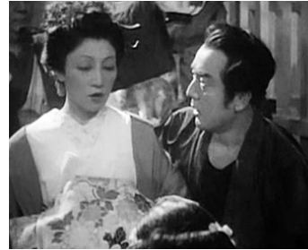
1937 YOSHIWARA de Max Ophüls avec Michiko Tanaka