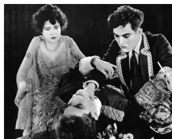
1920 THE BRAND OF LOPEZ de Joseph De Grasse avec Florence Turner