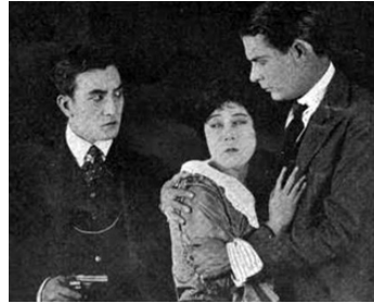
1916 ÂMES D'ÉTRANGERS (Alien Souls) de Frank Reicher avec Tsuru Aoki, Earle Foxe