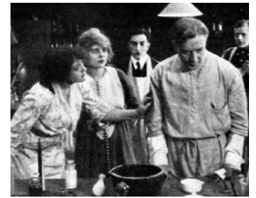
1915 LA TRACE (The Clue) de James Neill & Frank Reicher avec Blanche Sweet, E. McKay