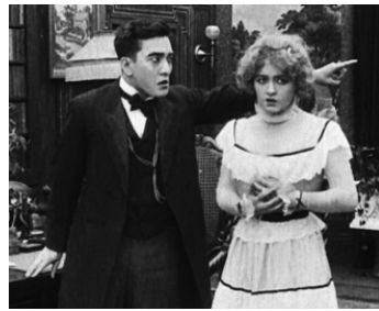
1914 L'HONNEUR JAPONAIS (The Typhoon) de Reginald Barker avec Gladys Blockwell