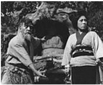
1914 LA COLÈRE DES DIEUX (The Wrath of Gods) de Reginald Barker avec Tsuru Aoki